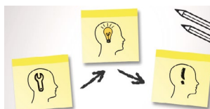
Lehrgang Compensation & Benefits Start: 18. Mai 2021