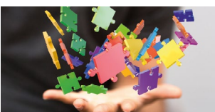
Lehrgang Personalcontrolling Start: 14. April 2021