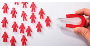
Lehrgang Recruiting Start: 8. Februar 2021