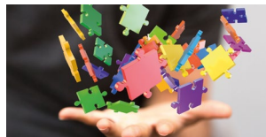
Lehrgang Personalcontrolling Start: 20. April 2020