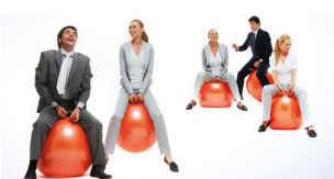
Lehrgang Personalentwicklung Start: 9. März 2020