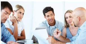
Personal-Akademie Start: 23. März 2020