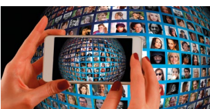
Digital Upgrade – Recruiting Start: 1. Juli 2020