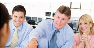
Lehrgang Recruiting Start: 10. Februar 2020 oder 28. September 2020